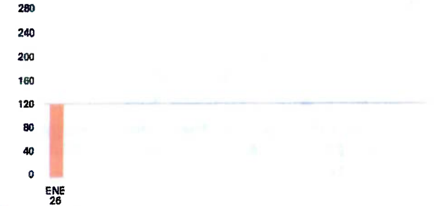
Evolución del consumo

En esta factura el consumo ha salido a 0.137329 €/kWh